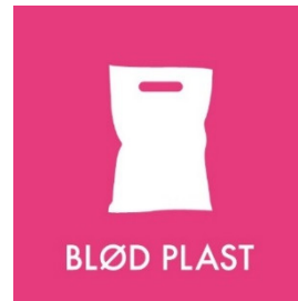
Plastfolie til genbrug Side 7