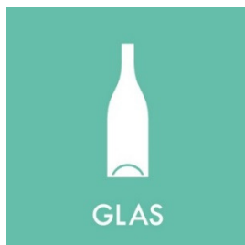
Glas, flasker og glasemballage Side 5