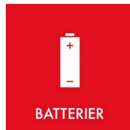
Blandede småbatterier Side 8