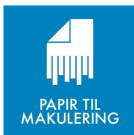
Papir til makulering Side 6