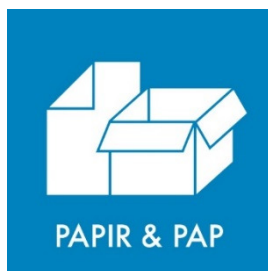
Pap og papir blandet Side 4