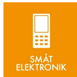
Småt elektronikskrot Side 9